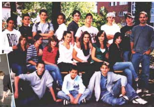
Die «Carwash-Aktion» der Sekundarschule Spreitenbach bildete die Grundlage für die Finanzierung des Projektes «Elternräte». Im Bild die Klasse S4a.

Organisation eines Rates, Jahresplanung, Budgetierung, Fundraising usw. ausgebildet werden. In der Umsetzung hat man dann einen etwas anderen Weg gewählt: Die Workshops waren kürzer, dafür wurde jeder Elternrat individuell weitergebildet. So konnten nicht nur einzelne Vertreterinnen oder Vertreter eines Rates erfasst werden, sondern alle in den Räten engagierten Eltern, insgesamt 734 Personen. Das Resultat ist erstaunlich: Die Eltern-