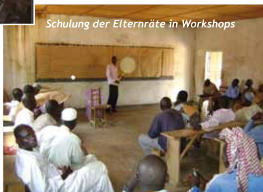
Schulung der Elternräte in Workshops

Organisation eines Rates, Jahresplanung, Budgetierung, Fundraising usw. ausgebildet werden. In der Umsetzung hat man dann einen etwas anderen Weg gewählt: Die Workshops waren kürzer, dafür wurde jeder Elternrat individuell weitergebildet. So konnten nicht nur einzelne Vertreterinnen oder Vertreter eines Rates erfasst werden, sondern alle in den Räten engagierten Eltern, insgesamt 734 Personen. Das Resultat ist erstaunlich: Die Eltern-