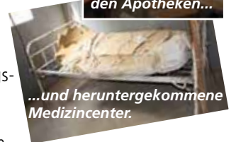
...und heruntergekommene Medizincenter.