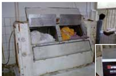
Die neue Waschmaschine, eine grosse Erleichterung.

Das Altersheim-Projekt ist schwer zu finanzieren. Einerseits will die Mehrheit der Spender nicht in alte Menschen investieren; das sei nicht nachhaltig. Andererseits handelt es sich um ein Programm ohne Ende; es gibt keinen Zeitpunkt, an dem es abgeschlossen wäre. IPA hat das Problem über Jahre so gelöst: Die Organisation