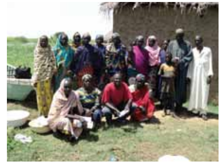
Oben: Diese Frauengruppe in Kamerun erhielt einen Kleinkredit

Dieses Geld kam zwei Frauengruppen aus den Dörfern Tékélé-Digue und Tchoukfou zugute. Sie hatten sich bei IPA um einen Kredit beworben, um ein Business zu betreiben, das ihnen und ihren Familien ein Einkommen sichert. Initiative Menschen, darunter auffallend viele Frauen, schliessen sich zu Gruppen zusammen und versuchen, gemeinsam ein Geschäft aufzubauen, meist in der Produktion oder Verarbeitung von Nahrungsmitteln. IPA hat 2010 über den Partner