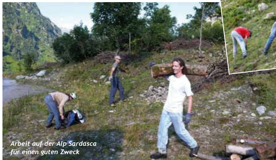
Arbeit auf der Alp Sardasca für einen guten Zweck