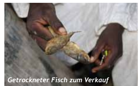
Getrockneter Fisch zum Verkauf

IPA hat in siebzehn Gymnasialklassen Werbung für diesen Einsatz gemacht. Doch nur zwei Jugendliche haben sich gemeldet. Dann aber stellten sich ehemalige Jugendliche des IPA-Juniorenteams und Freunde von ihnen für