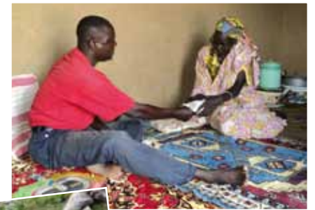
Unten: Die Vorsitzende der Frauengruppe nimmt die Kreditsumme entgegen