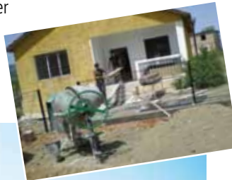
Das schucke, neu renovierte Medizinzentrum von Kalivaç

Die Renovation wurde in diverse Teilprojekte gegliedert, z.B.: Sanierung des Dachs, Sanierung der Decke, Einbau von neuen Fenstern und Türen, Erstellen eines Wasseranschlusses, Installation von Strom, Anstrich der Wände und der Mauern, Ausstattung des Zentrums mit Mobiliar