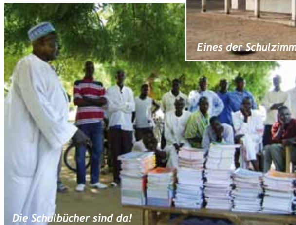
Die Schulbücher sind da!