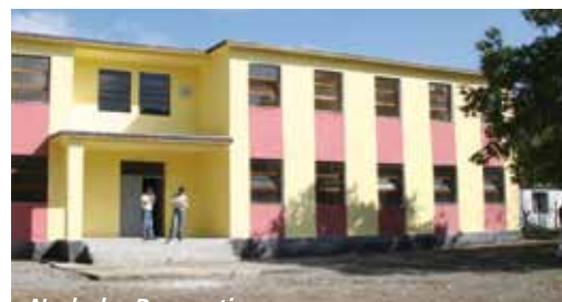
Nach der Renovation

Das Schulhaus musste aus Sicherheitsgründen im Sommer 2008 geschlossen werden. Vor der Schliessung gab es 74 Kinder in der Schule; 60 weitere waren be-