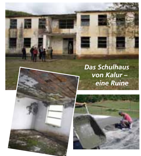
Das Schulhaus von Kalur - eine Ruine

Kalur liegt auf einer Hochebene im Distrikt Lezhë. Es ist eine abgelegene Region, die