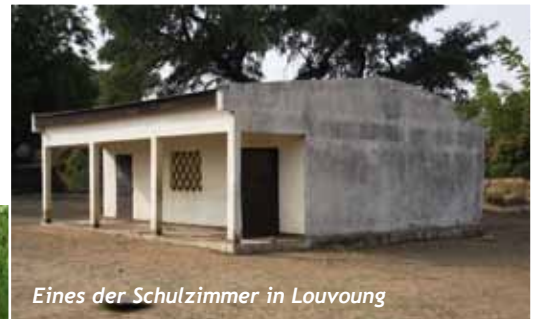
Eines der Schulzimmer in Louvoung

Louvoung ist ein Dorf in Nordkamerun mit etwa 3'000 Einwohnern. Es liegt in der Waza-Logone-Ebene, unweit des Flusses Logone, der die Grenze zum Tschad bildet. Die dortige Schule hat einen guten Ruf: Der Direktor ist tüchtig, die Eltern sind engagiert und die Lehrer zuverlässig. Die Schule ist in den letzten Jahren stets gewachsen - von 350 Schülerinnen und Schülern im Jahre 2005 auf mittlerweile 800 Kinder. Unterrichtet werden die sechs Jahre Primarschule. So