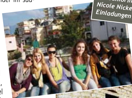
Nach der Arbeit treffen die drei mitreisenden Juniorinnen ihre albanischen Gastgeschwestern in Gjirokastrë.