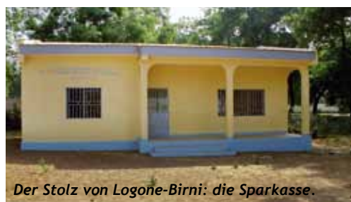
Der Stolz von Logone-Birni: die Sparkasse.

Logone-Birni liegt an der Grenze zum Tschad, in der Überschwemmungsebene des Flusses Logone. Vom Grenzort Kousseri ist es auf ei- ner staubigen Piste in einer Stunde Fahrt zu erreichen. Die sozialen Probleme sind gross, die meisten Menschen gehen keiner gere- gelten Arbeit nach. Sie leben vom Fischfang im Fluss (der wenig hergibt), von Viehzucht und Tierhaltung (Schafe, Ziegen, Hühner) sowie von Mais-, Reis-, Hirse- und etwas Gemüseanbau. Die Ernten fallen mager aus.