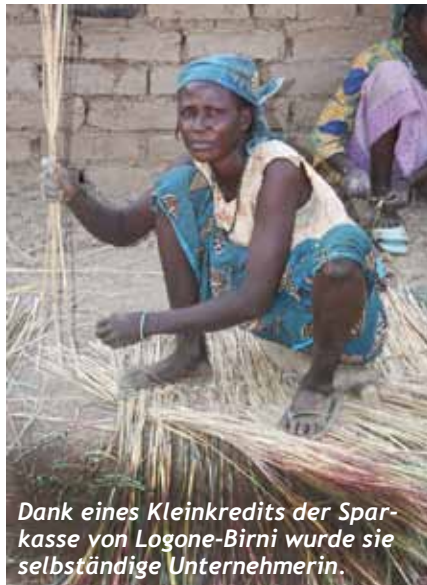
Dank eines Kleinkredits der Sparkasse von Logone-Birni wurde sie selbständige Unternehmerin.

Betrieb nötige Kapital zurückgreifen kann. Die Hoffnung auf eine Verbesserung der Lebenssituation dank eines Kredites ist in der Region spürbar. Nach Jahren der Lethargie hat sich die Stimmung aufgehellt. Verschiedene «Groupes d'initiative commune» (GICs), die nicht mehr aktiv waren, entwickeln nun Pläne und Geschäftsideen. GICs sind im Norden Kameruns verbreitet und bezeichnen eine Gruppe von Personen, die sich zu einem bestimmten Zweck zusammen-