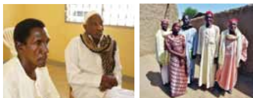
Der Generalsekretär und der Präsident; Gruppenbild rechts: das Leitungsgremium.

In den Monaten April bis August herrscht Hunger. Immer wieder muss das World Food Programme mit Nahrungsmittellieferungen zu Hilfe kommen. Das Dorf und die Region machen einen erbärmlichen Eindruck, viele Hütten stehen vor dem Zerfall. Zu allem Übel