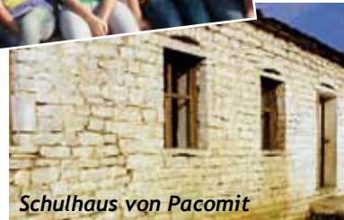
Schulhaus von Pacomit

dringend unsere Hilfe, doch wir können nur wenigen helfen. Nach gründlichem Abwägen haben wir uns