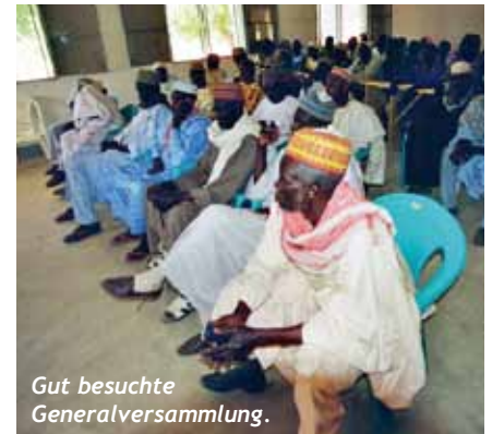
Gut besuchte Generalversammlung.

war es – bis vor kurzem – fast unmöglich, kleine Betriebe zu gründen. Zwar wurde in Logone-Birni auf Anregung der Afrikanis- chen Entwicklungsbank eine Sparkasse er-