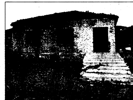
Renovationsbedürftiger Kindergarten in Bedar: Hilfe ist dringend notwendig.