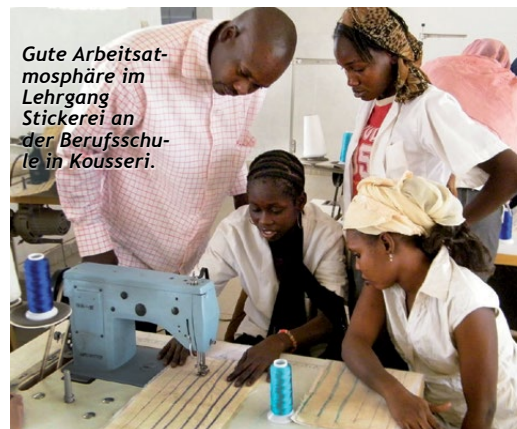
Gute Arbeitsatmosphäre im Lehrgang Stickerei an der Berufsschule in Kousseri.

Mehr noch als Entwicklungshilfe bietet IPA Menschen, denen es am Nötigsten fehlt, Entwicklungszusammenarbeit an: Wenn ein Trinkwasserbrunnen gebaut, eine Ambulanzstation eingerichtet oder ein Schulhaus renoviert ist, soll die Bevölkerung nicht länger auf IPA angewiesen sein, sondern ein würdiges Leben in Selbständigkeit führen können. Des-