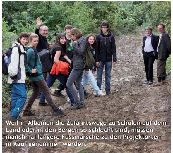
Weil in Albanien die Zufahrtswege zu Schulen auf dem Land oder in den Bergen so schlecht sind, müssen manchmal längere Fußmärsche zu den Projektorten in Kauf genommen werden.

In Albanien selbst wird hart gearbeitet. Es gilt, verschiedene Projektorte im Bildungs- und Gesundheitswesen zu besichtigen und mit den Betroffenen über deren Probleme und mögliche Lösungsansätze zu disku-