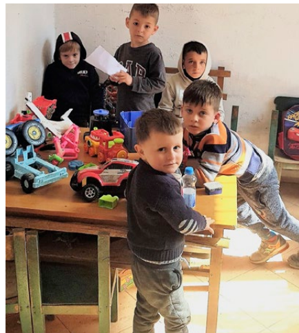
Vor dem Projekt waren die Kinder oft gestresst

ein Lehrer und bezog sich auf die Aussage der Kindergärtnerin. Dann kam noch das i-Tüpfelchen: eine kleine Bibliothek mit Büchern für die Kinder aller Stufen. Der Lesestoff wird ihre Freizeit bereichern und ihre Bildung vertiefen. Gibt es noch etwas, das fehlt, war die Frage in der Evaluationsitzung. „Nein. Wir haben wirklich alles bekommen, was wir brauchen.“ Das Dorf wird weiterleben. Es ist ein befriedigendes Gefühl für das Team von IPA und seinen Partnern in Albanien, wenn keine Bedürfnisse mehr offen bleiben. ■