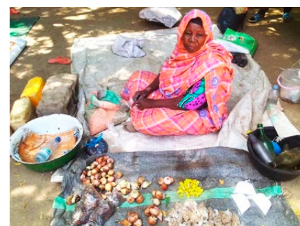
Mit ihrem Marktstand ernährt sie die ganze Familie

Heute sind sie stolze Besitzer eines kleinen Ladens, bewirtschaften ein Feld oder haben eine Viehherde aufgebaut. Die kleine Bank hat im ersten Jahr Kredite im Wert von 19,5 Millionen FCFA (fast CHF 30'000.-) vergeben. Die Laufzeiten bewegen sich meist zwischen fünf und sieben Monaten, bei einem monatlichen Zins von 0,5833%. Fairer geht nicht.