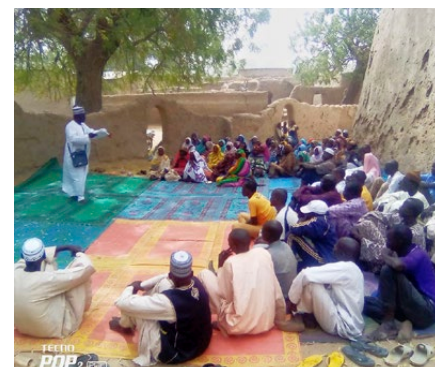
Informationskampagne in Goulfey

Schatten von Mauern orientierte man die Bevölkerung der Quartiere von Goulfey. Die verarmten Familien im äussersten Norden Kameruns waren begeistert von