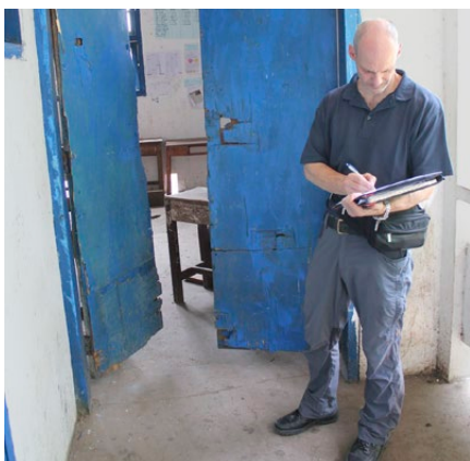
Bestandesaufnahme in der Schule von Kauyod

Über Jahre hatte man sich im Norden Kameruns sicher und überall willkommen gefühlt. Aber im Februar 2013 war plötzlich alles anders. Nur knapp entging das IPA-Team einer Entführung. Im gleichen Ort, in dem es 18 Stunden vorher noch lange gearbeitet hatte, war eine französische