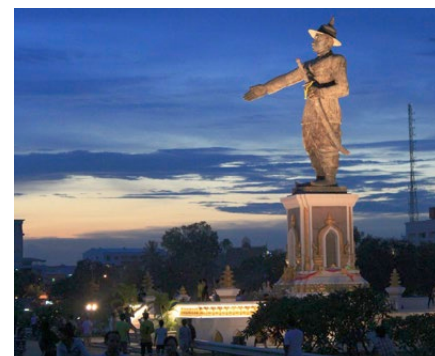
Es blieb bei spannenden Einblicken in ein fernes Land

anderes konnte man sich zu diesem Zeitpunkt kaum vorstellen. Das hiess aber nicht, dass IPA die Schutzschilde herunterfahren hätte. Auch die Reichweitensensoren blieben scharf. Und prompt trafen die ersten eigenartigen Mails ein. Er müsse zuerst ein