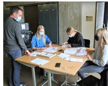
Die Basis des Erfolges: der MNG-Kurs

dennoch konnten von den 145 Kreditnehmern 126 pünktlich zurückzahlen. Dabei half die gute Beratung durch die Leitung der Kasse ebenso wie die Organisation der Mitglieder. Diese sind nach Quartieren oder Dörfern in acht Gruppen eingeteilt, von denen jede wieder ihre eigene Leitung hat. Alle Mitglieder treffen sich einmal pro Woche, man hilft einander und schickt seine Delegierten an die regelmässigen Treffen in der Zentrale der Sparkasse. So sind alle nahe dran an „ihrer“ Kasse, die Verbundenheit ist ebenso hoch wie die Transparenz. „Diese Anpassung an die lokalen Gegebenheiten hat einen grossen Erfolg ermöglicht“, berichtet der IPA-Partner aus Goulfey. Dank den Schülerinnen und