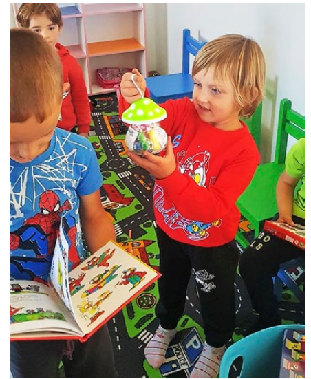
Die Kleinen freuen sich über die neuen Spielsachen

das Ganze mit einem kleinen Zusatzprojekt perfekt abzurunden. Der Raum wurde saniert, eingerichtet und ausgerüstet,