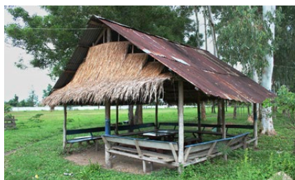
Lehrerzimmer der Schule von Bankeun

damit die Zusammenarbeit mit Kamerun abreißen könnte. Das war allerdings falsch. Wer so solide und zuverlässige Partner hat, kann über eine gewisse Zeit ohne Projektbesuche auskommen, auch wenn es zugegebenermassen frustrierend