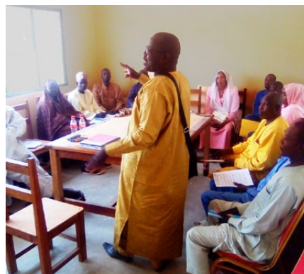
Ausbildung des Verwaltungskomitees

Was für ein Unterschied: Wo früher Wucherer bis zu 300% Zins pro Jahr verlangt haben, bezahlen die Familien heute bei ihrer lokalen Sparkasse noch 7%. Jugendliche vom Mathematisch-Naturwissen-