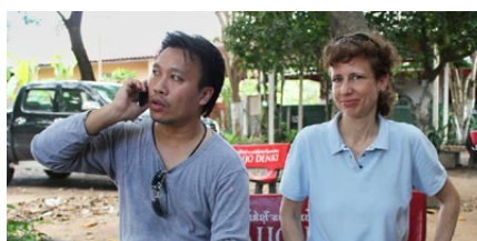
Nur auf den ersten Blick ein guter Partner