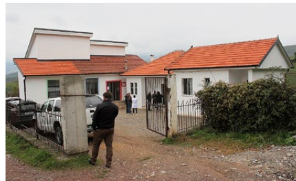
Schulhaus, Kindergarten, Ambulanzstation - ein kleiner Campus ist entstanden

für alle eine Mühsal. Und dann fügte sich plötzlich alles sehr schön: Die Behörden eines anderen Distrikts wollten für den Bau eines ihrer Ansicht nach zu kleinen Kindergartens keine Bewilligung erteilen. Ihr Anliegen war verständlich, aber IPA