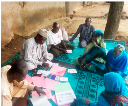
Treffen einer Quartiersgruppe der Kasse

überfluteten riesige Wassermengen, die aus Zentralafrika gekommen waren, die ganze Region. Drei Monate lang waren Goulfey und Umgebung abgeschnitten. Bauern litten ebenso wie Händler. Und