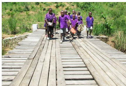
Auf dem Schulweg über die neue Brücke

Die Schule durfte bisher wegen Mangel an Räumlichkeiten die letzten zwei Stufen gar nicht anbieten. In Mwasukwe mussten