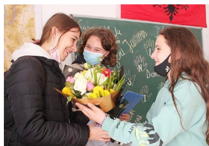
Gerührt von der grossen Dankbarkeit

Jugendlichen etwas übermotiviert an die Sache gehen. Die 9-Jahresschule von Luzni brauchte nichts weniger als eine Totalsa-