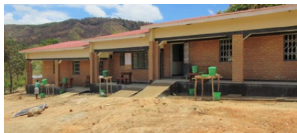
Das neue Schulgebäude in Mwasukwe

Den Anfang machten die Einnahmen im Zusammenhang mit dem Gottesdienst in der Kirche Dreikönigen. Auch jede weitere Zusage, jede Spende wurde mit grosser Freude registriert. Die Schülerinnen und Schüler haben regelrecht mitgefiebert. Schliesslich war das Ziel von CHF 140'000 erreicht. „Ich hätte es