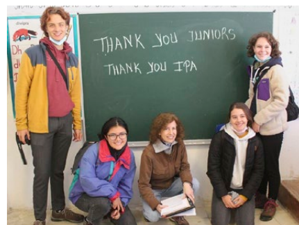
Das erfolgreiche Junioren-Team in Luzni

Ambulanzstation – eine Schwierigkeit, die die regionale Verwaltung mit einem eigenen Beitrag lösen wollte. Allerdings fanden in Albanien dann auch noch Wahlen statt, so dass sich die Umsetzung dieses Vorhabens