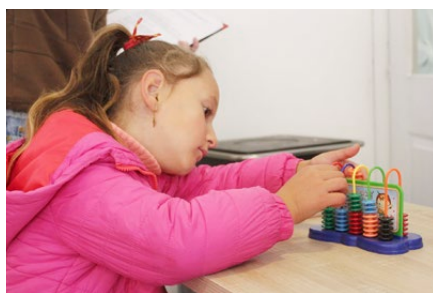
Dank neuem Material macht lernen Spass

einer Sitzung auch gleich noch, in Hotesch eine Ambulanzstation zu bauen. Einmal mehr hätte man meinen können, dass die