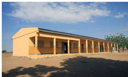
Schulgebäude in Kidam (nach der Renovation)

und Reparaturen – eine für ein armes Dorf in der Region enorme Summe. Finanziert wird der Unterhalt aus den Abgaben für die Benützung des Brunnens und einer jährlichen Einnahme aus der Fischerei. Das saubere Wasser hat schon unzählige Menschenleben gerettet.