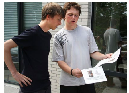
Lernen am realen Projekt