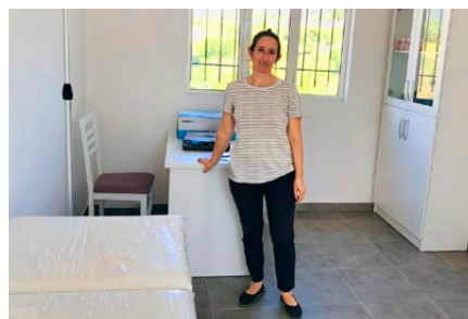
Die medizinische Grundversorgung ist gesichert - die Krankenschwester freut's

nierung, inklusive neuer Einrichtung bis hin zu einem Computerzimmer. Ein einzelnes Projekt grösser als das, was die meisten Schweizer Hilfswerke in einem ganzen Jahr in Albanien investieren. Im Nachbardorf Hotesch gab es am zerfallenden Gebäude für eine medizinische