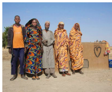
Das Verwaltungskomitee sorgt für den Unterhalt des Brunnens in Maskaläi