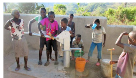
Sauberes Trinkwasser für die Kinder

Inzwischen steht in Mwasukwe ein neues Gebäude, das über Solarstrom verfügt, mit drei Schulzimmern und einem kleinen Raum für Lehrpersonen. Die Schule hat darum die Erlaubnis erhalten, alle acht Schulstufen anzubieten. Die Schülerinnen und Schüler haben Bücher, und eine Gruppe von Müttern führt ein kleines Geschäft, wo die Kinder Schreiber und Hefte günstig kaufen können. Die Einnahmen werden wieder in neue Materialien investiert, so dass die Schülerinnen und Schüler langfristig mit allem Nötigen versorgt sind. Diese Idee einer Schülerin wird