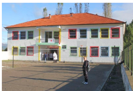
Das renovierte Schulhaus (mit Sportplatz) kann sich sehen lassen

Als ob es in der Schule Katund i Ri, in Luzni, nicht schon genug zu tun gegeben hätte, beschloss das Juniorenteam 2020/21 in