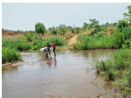
Abgeschnitten vom Rest der Welt

Kinder in zerrissenen Kleidern sitzen am Boden und langweilen sich. In ihrer Region gibt es keine Schule. Der Weg in die nächste Primarschule ist zu weit und in der Regenzeit von einem gefährlichen Fluss versperrt. 2'500 Menschen in fünf Dörfern lebten bisher in der Region Chatonda abgeschnitten vom Rest der Welt, ohne Infrastruktur.