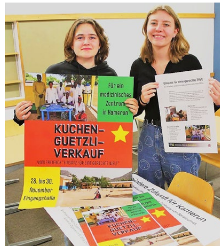
Volles Engagement am Ende des Kurses

zu organisieren? „Das ist doch nur ein Tropfen auf den heissen Stein bei diesem Budget.“ Eine wichtige Erkenntnis: Wer ein grosses Projekt finanzieren will, muss über die Sammelaktivitäten im eigenen Schul-