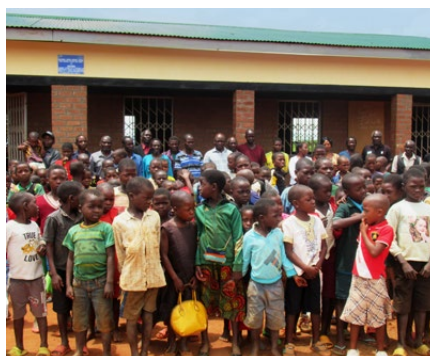
Fast 200 Kinder erhalten endlich Unterricht