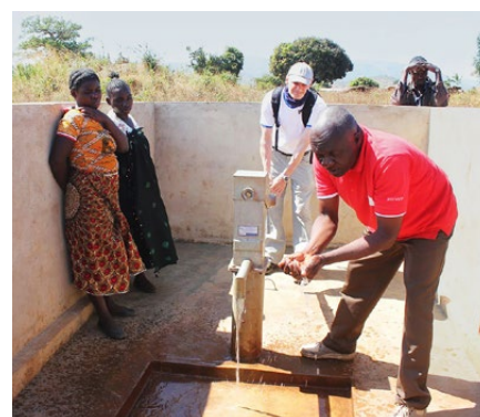
Projektkontrolle am Brunnen von Chiulukutu