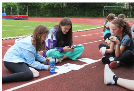
Rundenzahlen mit den Primarschülerinnen

abklären lassen, um sich dann genau zu überlegen, wie man eine ganze Region entwickeln könnte. Die so entstandene Prioritätenliste umfasste ein neues, mit Möbeln, Büchern und Materialien aus-