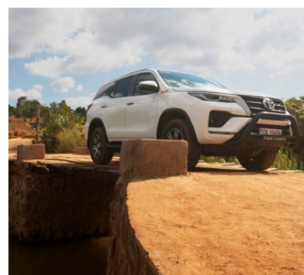
Selbstversuch: IPA-Mitarbeitende überqueren die neue Brücke im Juli 2024

Was dann folgte, bezeichnete ein Mitglied eines Brunnenkomitees als „Wunder von