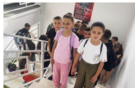
Strahlende Kinder am ersten Schultag

ausserschulischen Aktivitäten, und die Perspektiven der Kinder haben sich massiv verbessert. Natürlich hatte das Team von IPA nach der Umsetzung eine gewisse Dankbarkeit und Freude erwartet, aber die Reaktionen sind kaum in Worte zu fassen. Die Schulleiterin schrieb auf ihrer Facebook-Seite: „Wäre nur jeder so glücklich wie ich. Ich fliege vor Freude! Ich liebe dich, meine Schule!“ Eine Schülerin hatte ein rührendes Gedicht verfasst, in dem sie ihr langes Warten auf eine 'richtige' Schule beschrieb. Das Projekt hat viel Hoffnung in eine abgelegene Region gebracht. Und es hat bewiesen, dass eine Zusammenarbeit