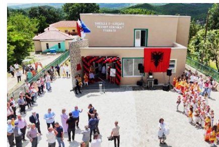
Grosse Einweihungsfeier im Sommer 2024

Es sollte sich lohnen. Der Bürgermeister hielt Wort, das gemeinsame Grossprojekt gelang. Im September, zu Beginn des neuen Schuljahres, konnte ein schönes