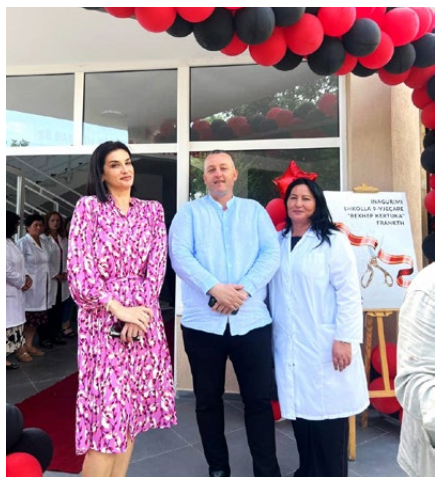
IPA-Partnerin, Bürgermeister, Schulleiterin

ausserschulischen Aktivitäten, und die Perspektiven der Kinder haben sich massiv verbessert. Natürlich hatte das Team von IPA nach der Umsetzung eine gewisse Dankbarkeit und Freude erwartet, aber die Reaktionen sind kaum in Worte zu fassen. Die Schulleiterin schrieb auf ihrer Facebook-Seite: „Wäre nur jeder so glücklich wie ich. Ich fliege vor Freude! Ich liebe dich, meine Schule!“ Eine Schülerin hatte ein rührendes Gedicht verfasst, in dem sie ihr langes Warten auf eine 'richtige' Schule beschrieb. Das Projekt hat viel Hoffnung in eine abgelegene Region gebracht. Und es hat bewiesen, dass eine Zusammenarbeit