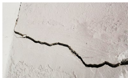
2022: Tiefe Risse in den Wänden der Schule

Oktober 2022, ein kühler Tag in den Bergen Nordalbanien. Der VW-Minibus hatte sich brav die steile und rutschige Naturstrasse nach Frankth hinaufgekämpft. In Begleitung einer Delegation des Juni-