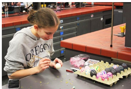
Jede Aktion half dem Projekt

Gruppe funktioniert. Die Spaltung zwischen den Zugpferden und anderen wurde immer grösser. Dazu kam eine Sinnkrise. Lohnte es sich überhaupt, Kuchenverkäufe