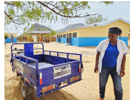
Der unscheinbare Held des Projekts