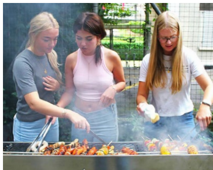
Grilltag als Fundraising-Event

Mindestens ein Trinkwasserbrunnen für das Dorf Gogom im Bezirk Maga – das war das Ziel einer Klasse der Kantonsschule Hottingen zu Beginn ihres Kurses mit IPA. An Ideen im Bereich Fundraising mangelte es nicht. Aber das Sammeln von Spenden für ein Projekt ist Knochenarbeit. Die Zusammenarbeit mit dem Schulchor kam nicht zustande, Fundgegenstände liessen sich nur schwer verkaufen, Teilnehmende für ein Spendschwimmen konnten nicht gefunden werden. Die Jugendlichen liessen sich davon nicht unterkriegen und organisierten noch zwei Monate nach