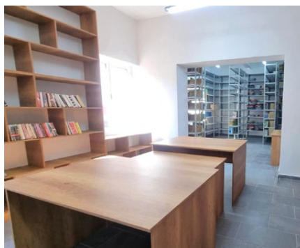
Bereit für die Wiedereröffnung

grossflächig von den Wänden. Diese Situation hatte gravierende Folgen: Die völlig veralteten Strominstallationen wurden zur Gefahr. Heizkörper – eine Zentralheizung gibt es nicht – konnten nicht mehr angeschlossen werden. Im Winter war es unerträglich kalt, und