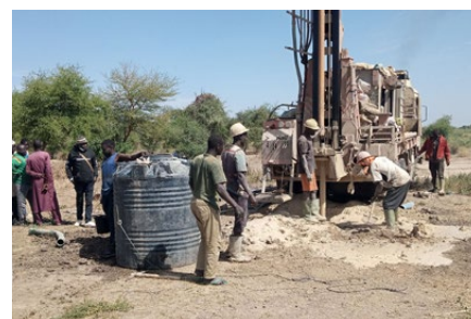
Die dritte erfolglose Bohrung in Merew

Hydrologische Gutachten sind zwar hilfreich, aber nicht immer präzise. Das Projekt zeigte, dass man hier nie Trinkwasser haben wird. Die niederschmetternde Erkenntnis führte im Dorf zu einer intensiven Diskussion. Wegziehen oder bleiben? Die Jüngeren wollen weg, die Älteren warnen, dass bei einer Umsiedlung eines ganzen Dorfes unklar bleibt, ob man genügend