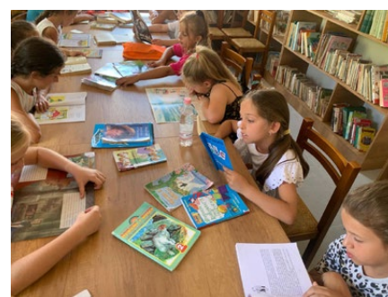
Viele Schulklassen kommen zu Besuch

Bürgermeister. Im indirekten Kontakt über die lokale Partnerorganisation in Albanien kam man schnell überein, die Probleme gemeinsam anzugehen. Die guten Erfahrungen in der Zusammenarbeit in früheren Projekten hatten dafür einen soliden Boden gelegt, sprich viel Vertrauen geschaffen.