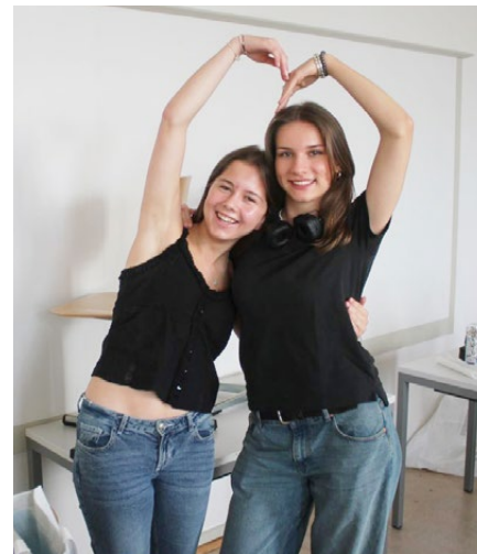
Ein grosses Herz für die Kinder in Rumphi

Einsatz. Die Infrastruktur stammt unverändert aus dem Jahr 1970, die Apotheke ist abgebrannt. Das Budget: monatlich rund CHF 21'000.- – nötig wäre mehr das Doppelte! Die Schulden der Institution belaufen sich inzwischen auf über CHF 100'000.-. Das Geld reicht nicht einmal mehr für genügend Treibstoff für die Krankenwagen, und man befürchtet, dass bald Strom oder Wasser abgestellt werden könnten. Es gibt nur halb so viele Betten wie stationäre Patientinnen und Patienten. Dazu kommen noch 300 Geburten pro Monat. Ein einziger alter Sterilisator stand bisher zur Verfügung. Doch die Zahlen sind das eine. Ein Gang durch das Elend ist eine noch viel grössere Belastung. Spätestens in der Geburtsabteilung wird es selbst den erfahrenen IPA-Geschäftsleitenden zu viel. Das Projekt der KSH aber rettet Leben und stärkt das immer noch erstaunlich motivierte Personal.