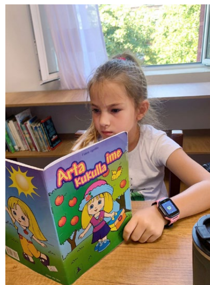
Kleine Leserin, grosses Interesse (im Hintergrund eines der sanierten Fenster)

sollten Kinder oder Erwachsene in die Bibliothek kommen? Diese Frage stellten sich nicht nur das Personal und Mitarbeitende von IPA, sondern auch der