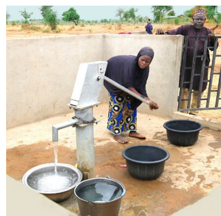
Siaw hat einen Brunnen „geerbt“

und gutes Ackerland findet. Noch immer sind die Beratungen im Gang. Ähnliche Sorgen plagen die Menschen in Djiddel, wo es zwar viel, aber nur salziges Wasser gibt. Auch hier hat das Projekt alle Zukunftshoffnungen zerschlagen. Anstelle