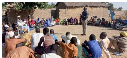
Wahl des Verwaltungskomitees in Gogom

lieber an anderen Orten kaufen wollten. Dennoch konnte der Brunnen für Gogom finanziert werden. Angesichts der Schwierigkeiten in der Mittelbeschaffung ist das ein beachtlicher Erfolg. Und weil die Situation im Norden Kameruns so dramatisch ist, steuerte IPA aus einer Schenkung