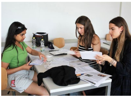
Der Briefversand brachte viele Spenden ein