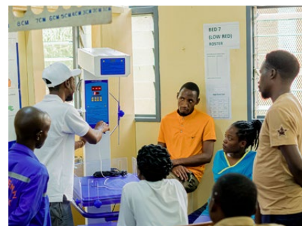
Weiterbildung des Personals an den Geräten

Es waren Hottinger Jugendliche, die 2023 ein Projekt zur Unterstützung der medizinischen Versorgung im Spital von Rumphi starteten. Aber wo sollte man anfangen bei so vielen Bedürfnissen? Wunschlisten des Direktors und eine lange Diskussion in der Klasse halfen beim Entscheid: Ein