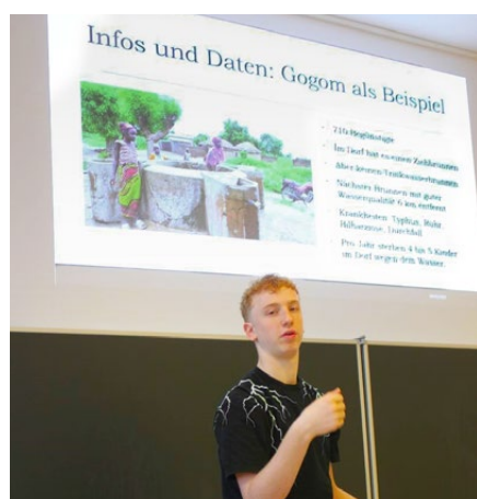
Vorstellung der Projekte in Hottingen

dieser beiden Dörfer haben Siaw und Doumdéré-Tchabawol profitiert. Dort hat sich die Lage ebenso deutlich verbessert wie in Gogom und Goulouf. Weniger Kranke, weniger Tote. Eine Entwicklung ist angestossen. Traurig nur, dass die Bewohner von Djiddel und Merew daran nicht teilhaben können. ■