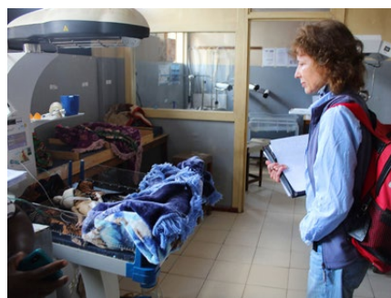
Schwer zu ertragen: IPA zu Besuch im Spital

Wer das Rumphi District Hospital besucht, braucht starke Nerven. Schon die Zahlen sind erschütternd: Für 330'000 Menschen stehen drei Ärzte im