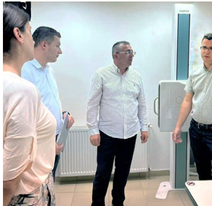
Beginn der Weiterbildung

nierendes Röntgengerät zu bieten. Diesen Wunsch zu formulieren, fiel dem sympathischen Direktor aber schwer: „IPA und Vizion O.J.F. haben bereits so viel für uns gemacht. Ich schäme mich,