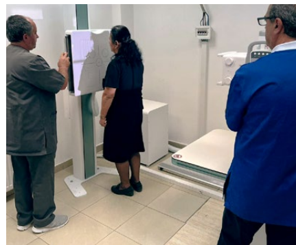
Test mit Patientin

Die IPA-Partnerin bestellte das Gerät über eine albanische Firma in Japan, im wahrsten Sinne des Wortes eine grosse Kiste – und auch im übertragenen Sinn für das Team der lokalen NGO, das noch kein vergleichbares Projekt umgesetzt hatte. Schon bald kamen die ersten Berichte von Verzögerungen. Zuerst lag es an Corona, dann am Krieg in der Ukraine. Lieferketten waren unterbrochen, Schiffe mussten im Hafen bleiben oder konnten nur mit Verspätung auslaufen. Eine Anzahlung war bereits etliche Monate vorher geleistet worden.