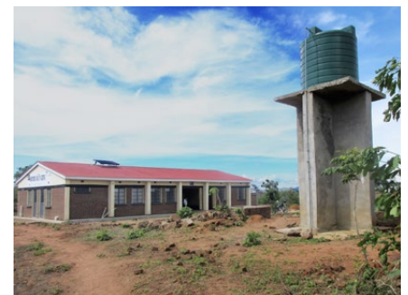
... und die Station heute

Vorhaben noch nicht beendet, aber das Gebäude ist fertiggestellt und verfügt über Strom und Wasser. Es gibt Latrinen, einen