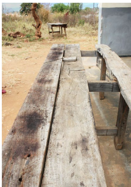
Die Werkbänke für Sanitär- und Schrei- nerausbildung

Das sollen die sieben Säulen der Resilienz sein: Optimismus, Akzeptanz, Lösungsori- entierung, das Verlassen der Opferrolle, ein Erfolgsnetzwerk, positive Zukunftsplanung