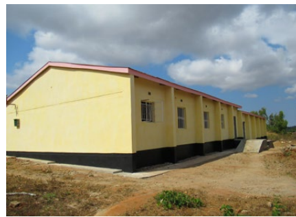
Schwieriger Prozess, schönes Ergebnis

In Ezondweni war es nicht einfacher. Die Probleme begannen mit Einschränkungen auf der Baustelle. Der IPA-Partner fiel wegen Corona wochenlang aus, der Besitzer der Baufirma starb mitten im Projekt. Missverständnisse bei der Freiwilligenarbeit und beim Wassertransport kamen dazu. Und als dann noch der Vorarbeiter die Flinte ins Korn warf, stand das Vorhaben eine Weile still. Resilienz? Der lokale Partner ging mit gutem Beispiel voran. Aufgeben war keine Option. Er machte den perfekten Vorschlag: Ein gut funktionierendes Team von Bauarbeitern