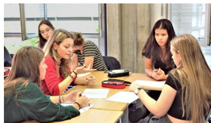
Intensive Diskussionen in den Gruppen

wurden genau studiert, in den Diskussionen nahm man sich Zeit für eine ausführliche Argumentation. Weder die Planung von Events noch die Übersetzung von zehn Seiten Text aus dem Englischen machten der Gruppe Mühe. Geduldiges Arbeiten wurde gepaart mit der Begeisterung für das Projekt und der Freude, anderen Menschen helfen zu können. Entsprechend gut kam auch die Projektpräsentation vor der Lehrerschaft an. „Das war das Berührendste, was ich in 22 Jahren im Konvent erlebt habe“, schrieb danach eine Lehrperson. Auch die Vorstellung des Vorhabens vor einer ausgewiesenen Spezialistin