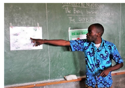
Engagierter Lehrer im Theorieunterricht

von Ezondweni. Es ist die einzige staatliche Berufsschule im Einzugsgebiet von 600'000 Menschen. Eine praktische Ausbildung war für angehende Schreiner oder Sanitärin- stallateurinnen inexistent. Eine uralte