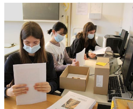
Versand des Projektbeschriebs

Werkbank, keine Maschinen, ja nicht einmal ein Praxisraum waren vorhanden. Wie soll man da ein Handwerk erlernen können? Dabei gäbe es intakte Chancen für junge Menschen mit einer guten Aus- bildung in diesen Erwerbszweigen.