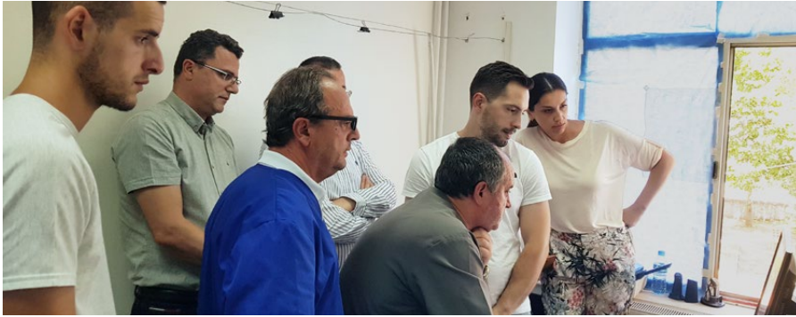
Gespanntes Warten auf die ersten Bilder

Anfang August war es dann endlich soweit. Spezialisten installierten innerhalb von zwei Tagen das Gerät, das Personal wurde geschult, und in Anwesenheit des Bürgermeisters und eines hochrangigen Beraters vom Gesundheitsministerium nahm man das neue Herzstück des Spitals in Betrieb. Der Direktor atmete auf. Er hatte sich Sorgen gemacht, dass es zur Unzeit einen Notfall geben würde. Es existierte schon eine Liste von Patientinnen und Patienten, die nun untersucht werden konnten. Die Begeisterung der Ärzte angesichts der ersten Röntgenaufnahmen entschädigte alle für die lange Wartezeit. ■