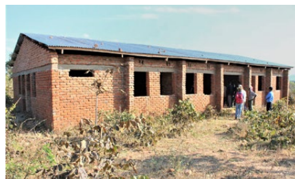
Der Rohbau der lokalen Bevölkerung...

In Mjuma konnten bisher einfachste gesundheitliche Probleme nicht behandelt werden, Geburten waren ein grosses Risiko, und die Überwachung von chronisch Kranken war nie möglich. Die Bevölkerung der Region hatte in ihrer Verzweiflung selber eine