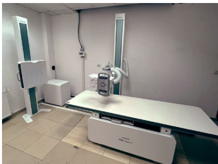
Das neue Gerät fertig installiert