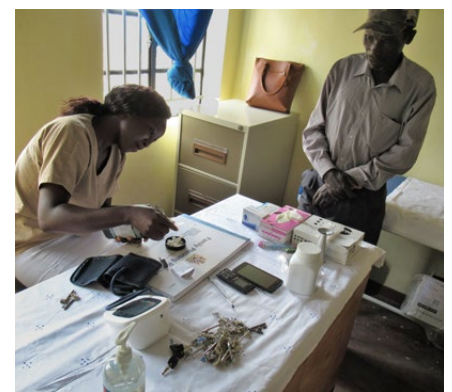
Endlich eine medizinische Versorgung

Verbrennungsofen, eine Plazentagrube und sogar eine kleine Wäscherei, um die nötige Hygiene zu gewährleisten. Die Gemeinde hat eine Krankenpflegerin angestellt, die vorerst einmal die wichtigsten Dienste vor allem für Kinder und schwangere Frauen